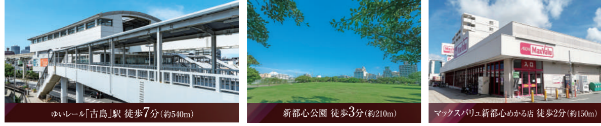
※表示距離は現地からの地図上の概算です。徒歩分数は80m=1分として算出し、端数は切り上げております。※地図は簡略化しています。※掲載の環境写真は2023年4月、2024年1月・2月に撮影したものです。

■物件概要 ●物件名/ワイズエステムコート新都心銘苅 ●所在地/沖縄県那覇市銘苅1丁目10-1 ●交通/ゆいレール「古島」駅徒歩7分(約540m) ●地域/第二種低層住居専用地域 ●建築確認番号/第沖研R05160211号(令和5年12月15日) ●構造/鉄筋コンクリート造、地上12階建 ●総戸数/31戸 ●敷地面積/1,111.28㎡ ●建築確認敷地面積/1,111.28㎡ ●建築延べ床面積/308.09㎡ ●建築延べ床面積/2,671.00㎡(容積不算入面積450.25㎡) ●建ぺい率/60.00%(法定)、27.73%(対象) ●容積率/200.00%(法定)、199.84%(対象) ●専有床面積/62.56㎡~90.88㎡ ●バルコニー面積/13.23㎡~37.73㎡ ●アルコーブ面積/3.18㎡~6.04㎡ ●専用ポーチ面積/5.39㎡ ●インナーテラス面積/12.10㎡ ●ルーフトバルコニー面積/72.28㎡ ●間取り/3LDK ●権利形態/敷地は専有床面積割合による共有、建物専有部分は区分所有権、建物共用部分は専有床面積割合による共有 ●管理形態/区分所有者全員により管理組合を設立し、管理会社に委託 ●管理員の勤務形態/通勤管理方式(日勤) ●駐車場/51区画(61台) 月額使用料:3,500円~17,000円 ●7区画 月額使用料:200円 ●着工/2023年12月25日 ●竣工予定/2025年7月下旬 ●入居開始予定/2025年8月下旬 ●施工/南洋土建株式会社 ●設計・監理/株式会社泉設計 ●管理会社/株式会社エステム管理サービス ●一級建築士事務所/大阪府知事登録(ホ)第17185号・近畿不動産協会(公)販売代理/株式会社エステム住宅販売 〒542-0081 大阪府中央区南船場2丁目9番14号 TEL:06-7660-1177(代表) ●宅地建物取引業免許証番号/国土交通大臣(2)第8803号 (一社)九州不動産協会(公)近畿地区不動産公正取引協議会 ●第二期販売概要 ●販売戸数/3戸 ●専有床面積/70.22㎡、75.44㎡ ●バルコニー面積/13.23㎡、14.63㎡ ●間取り/3LDK ●販売価格(税込)/6,270万円(1戸)~6,980万円(1戸) ●管理費(月額)/11,020円、11,840円 ●修繕積立金(月額)/5,610円、6,030円 ●修繕積立基金(一括)/448,800円、482,400円 ●広告有効期限/2024年12月1日