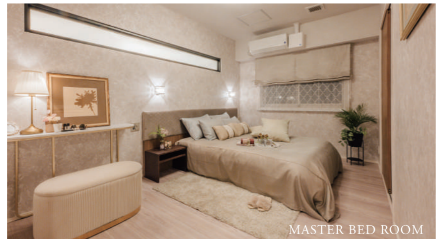
MASTER BED ROOM