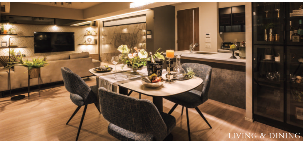
LIVING & DINING